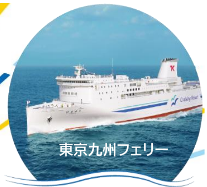
東京九州フェリー