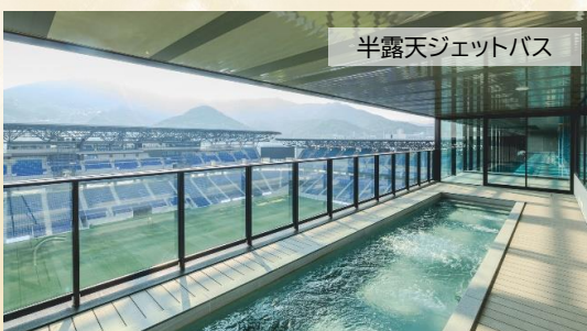
半露天ジェットバス