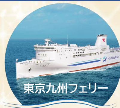
東京九州フェリー