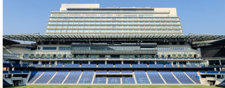
日本初のサッカースタジアムビューホテル スタジアムシティホテル長崎