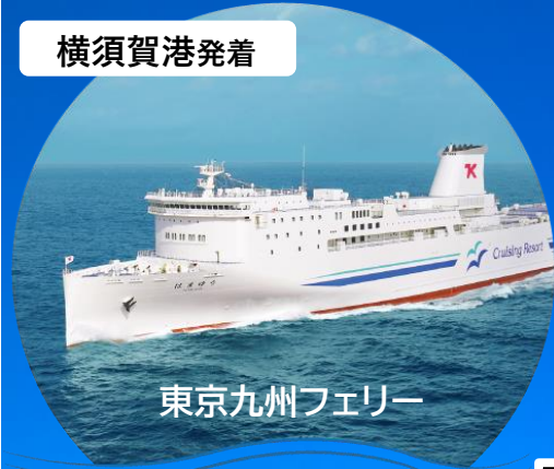
東京九州フェリー