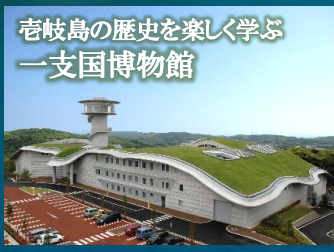
壱岐島の歴史を楽しく学ぶ 一支国博物館