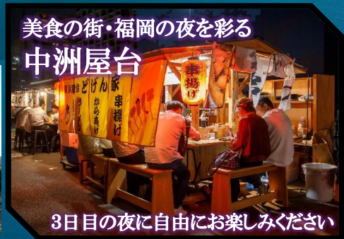
美食の街・福岡の夜を彩る 中洲屋台