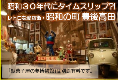
「駄菓子屋の夢博物館」は別途有料です。