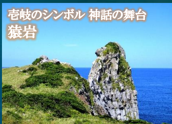
壱岐のシンボル 神話の舞台 猿岩