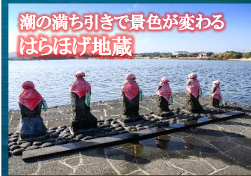
潮の満ち引きで景色が変わる はらぼげ地蔵