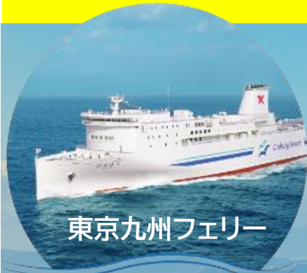
東京九州フェリー