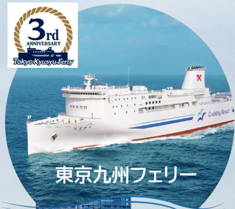
東京九州フェリー