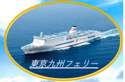
東京九州フェリー